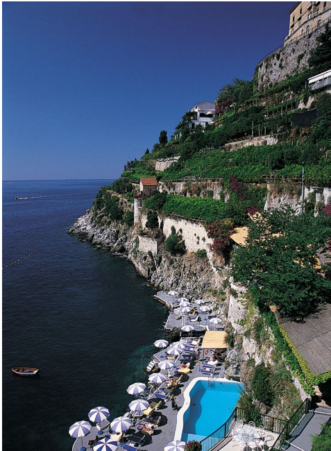
HÔTEL SANTA CATERINA - AMALFI