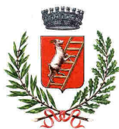
COMUNE DI ANACAPRI